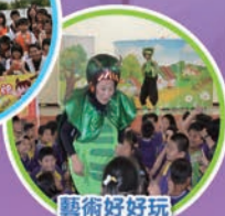
藝術好好玩 戲劇巡演