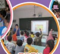
藝術賞析 數位教材