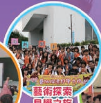
藝術探索 見學之旅